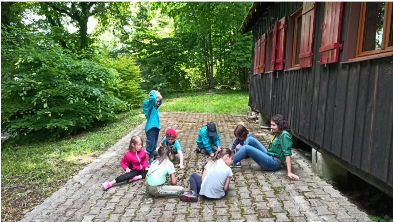
Reprise des activités scouts chez le groupe St-Pierre