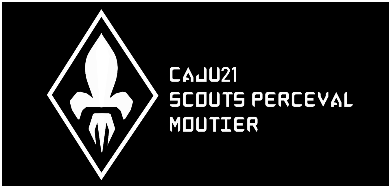
Bannière du CAJU21